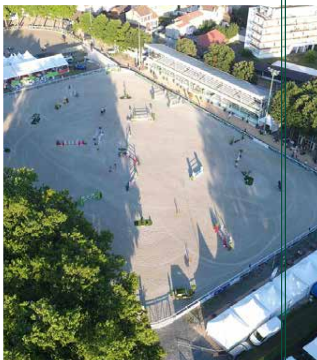
Le nouveau terrain en sable.

Le magnifique et vaste terrain en sable fibré , qui fêtera son premier anniversaire , offrira un espace hors du commun aux chevaux pour s'exprimer devant la magnifique tribune construite par Gustave Eiffel qui signe un décor exceptionnel. L'organisation vous proposera un spectacle sportif d'une très grande qualité devant un public Vichyssois très enthousiaste. Tous les ingrédients seront réunis pour faire de cet évènement un moment inoubliable.